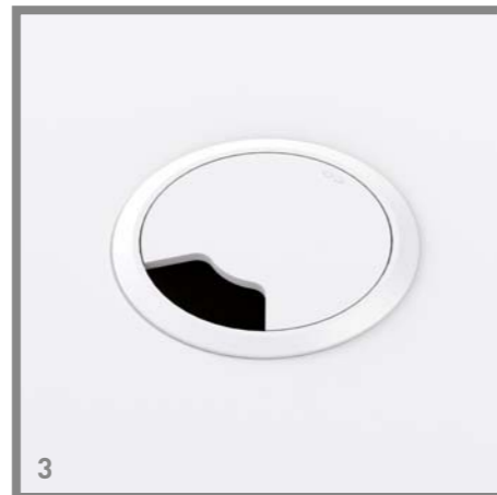
3 | Desk grommet, round | Kabeldoorvoerdop, rond