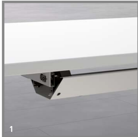
1 Horizontal cable duct for screw connection under table top Horizontale kabelgoot voor montage met schroeven onder tafelblad