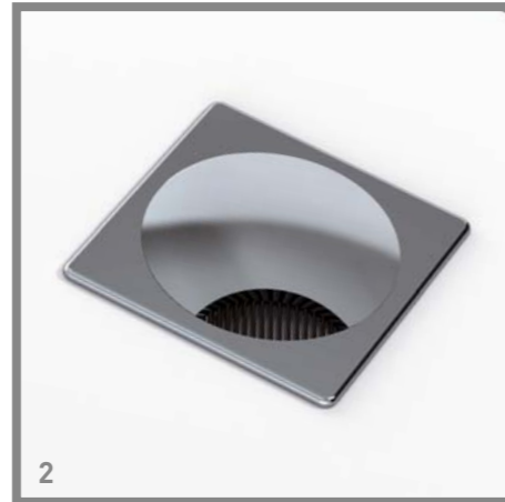
2 Desk grommet, square, made of die-cast zinc | Kabeldoorvoerdop, vierkant, gemaakt van gegoten zink