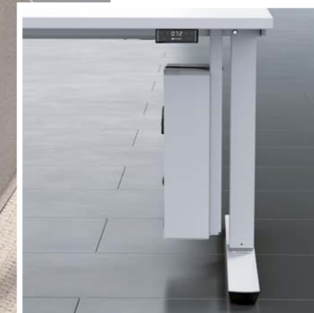
CPU - holder for mounting under the table top with safety belt

N Het achteraf inbouwen van een Easy Stop sensor is mogelijk. De Easy Stop sensor versterkt de antibotsingsfunctie door het meten van bewegingsimpulsen op het plaatframe en biedt zo bescherming tegen onbedoeld contact met de tafel.