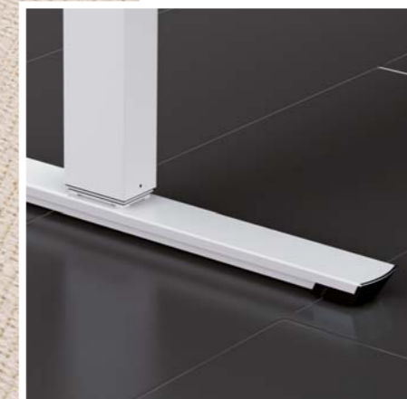
Optional kann an Stelle der Rohrkufe die CREW Kufe (T-Fuß) ausgewählt werden | Optionally the CREW skid (T-foot) can replace the pipe skid | Optioneel kan de CREW teen (T-voet) de buis-teen vervangen.