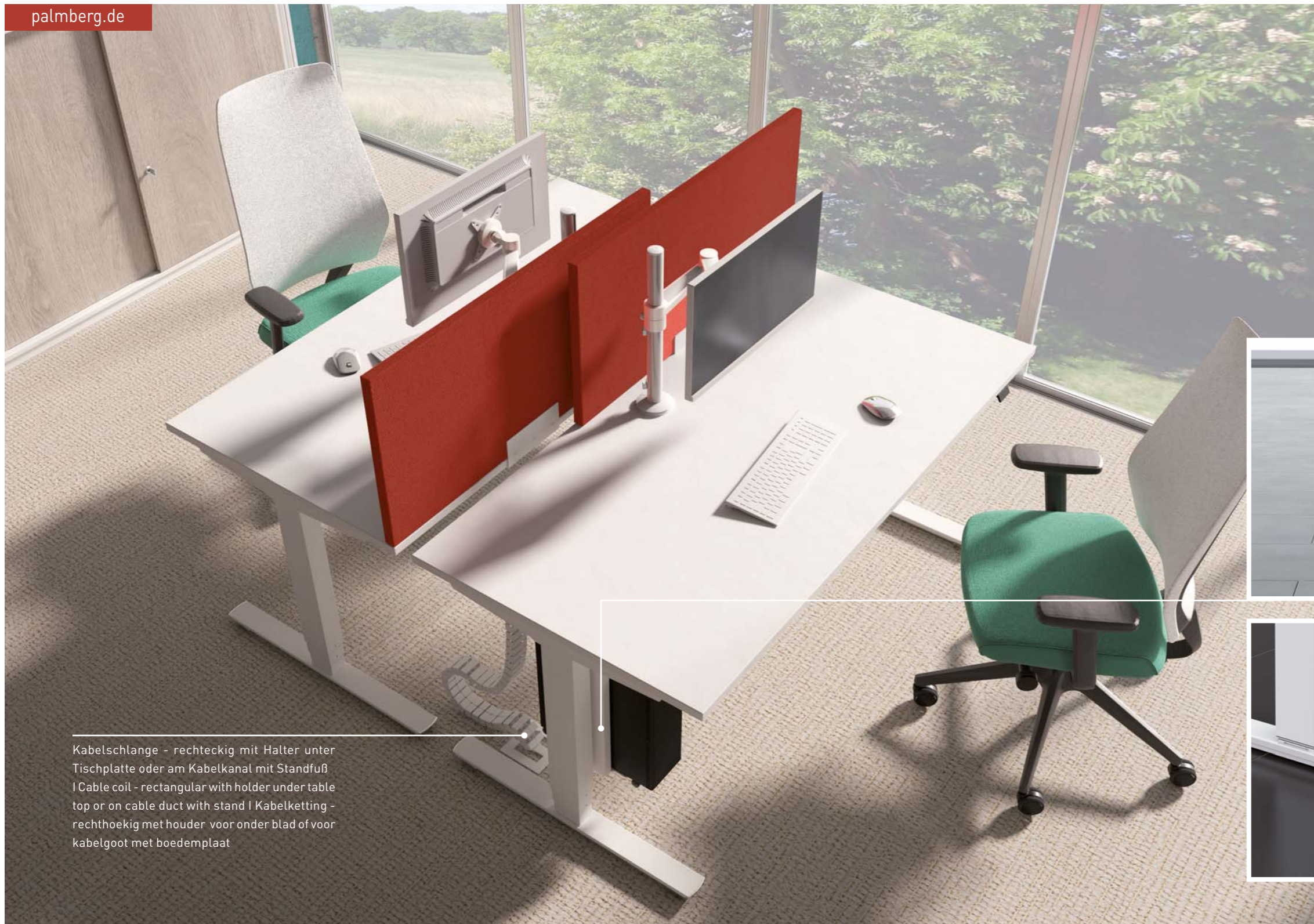
Kabelschlange - rechteckig mit Halter unter Tischplatte oder am Kabelkanal mit Standfuß | Cable coil - rectangular with holder under table top or on cable duct with stand | Kabelketting - rechthoekig met houder voor onder blad of voor kabelgoot met boedemplaat

E The upgrade to an Easy Stop sensor is possible. The Easy Stop sensor increases the anti-collision function by measuring movement pulses on the table top frame and thus offers protection against unintentional contact by the table.