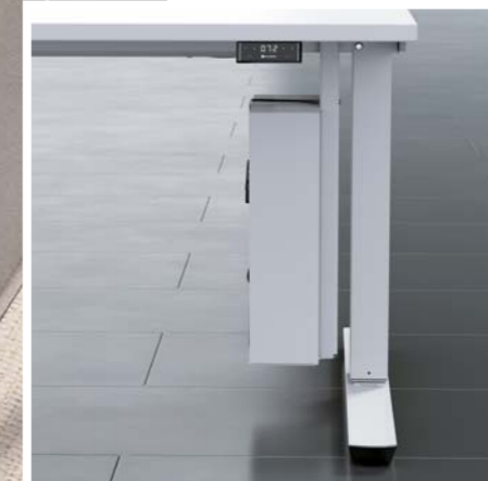
CPU - holder for mounting under the table top with safety belt

N Het achteraf inbouwen van een Easy Stop sensor is mogelijk. De Easy Stop sensor versterkt de antibotsingsfunctie door het meten van bewegingsimpulsen op het plaatframe en biedt zo bescherming tegen onbedoeld contact met de tafel.